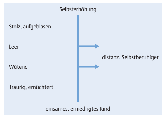
Abb. 3 Dynamik der Schemamodi in der NPS.

Durch das Moduskonzept wird es möglich, die therapeutischen Interventionen und die Haltung dem jeweilig aktuell dominierenden Zustand des Patienten anzupassen. Statt den Patienten in seiner Gesamtheit anzusprechen, werden verschiedene Seiten in ihm adressiert. Dieses Vorgehen führt zu einer Entstigmatisierung und fördert die Zusammenarbeit.